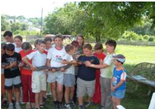
A gyerekek egyik kedvence a Piton volt

Összességében elmondható, hogy feledhetetlen, élményekben gazdag napokat töltöttünk el együtt, a diákok hasznos ismeretanyaggal bővíthették tudásukat.