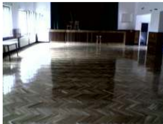
Az új parkett

A Művelődési Ház évek óta tartó részleges felújításaként ebben az évben a színház és tornaterem parkettájának teljes cseréjére került sor.