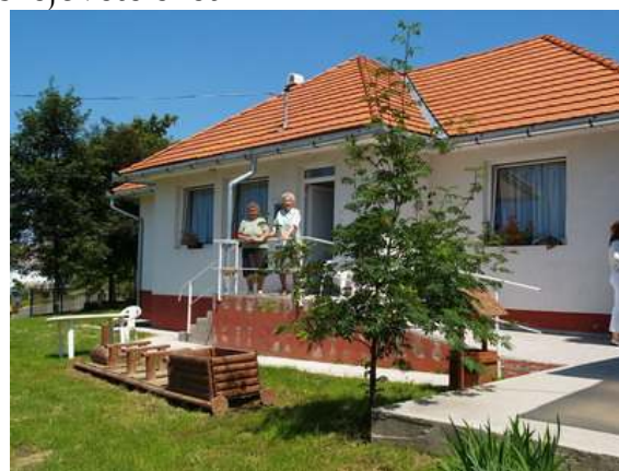
A Gondozási Központ épülete

Jelenleg a nyári „uborkaszegzon” napjait, heteit éljük, készülődve, tervezgetve nyár végi bográcsozós, gyógyfürdős összejöveteleket.