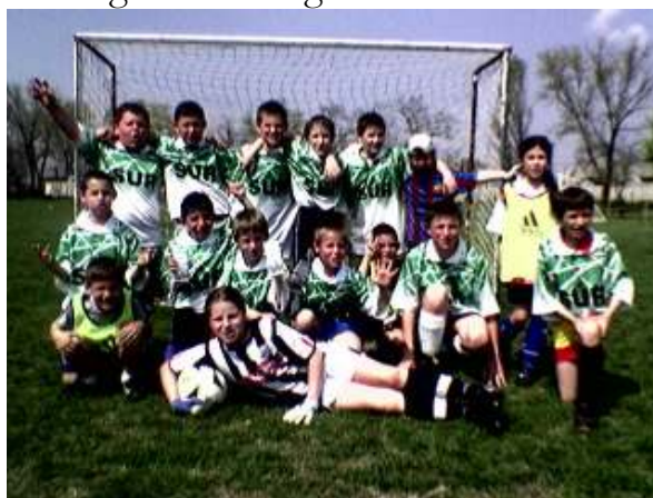
Az utánpótlás csapat