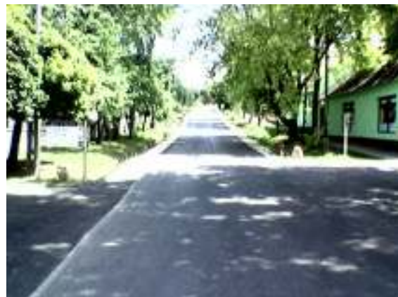
Szabadság tér és Deák utca új aszfaltburkolata

A Deák F. utca és Szabadság tér útburkolat felújítási munkáit az Állami Közútkezelő Kht. Kisbéri Üzemtechnika végezte el. A két közterület bekerülési költsége bruttó 10.526.044 Ft-ba került, melyből pályázat útján a Közép-Dunántúli Regionális Fejlesztési Ügynökségtől 5.262.693 Ft-ot nyertünk el.