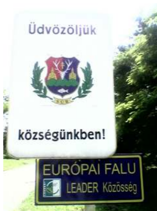
LEADER+ Közösséghez tartozást jelző tábla

2005. júniusában megalakult a kistérségi kistérség önkormányzatainak, gazdasági szervezeteinek és civil szervezeteinek részvételével a Bakonyalja Akciócsoport. A Földművelésügyi és Vidékfejlesztési Minisztérium pályázati felhívására elkészítettük a kistérségi vidékfejlesztési tervet, melynek alapvető célkitűzései a helyi lakosság életminőségének, életfeltételeinek, jövedelmi helyzetének javítása, a kistérség népességmegtartó erejének növelése, a fenntartható vidékfejlesztés gyakorlatának elterjesztése, alkalmazása.