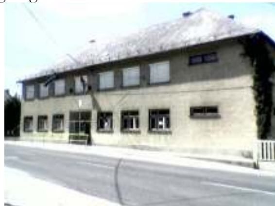
Arany János Általános Iskola