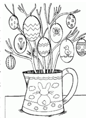
Színezhethetnek a gyerekek

Festhetünk különleges, színátmenetes húsvéti tojásokat. A titka annyi, hogy először csak kevés festőlébe állítsuk a tojást, majd fokozatosan emeljük a "vízszintet". A végén, mikor teljesen ellepi, már csak egész kevés ideig hagyjuk benne, hogy épphogy megfesse a felső részt. Időigényes, de gyönyörű!