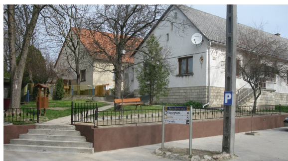
A parkoló környezete is esztétikusabbá vált