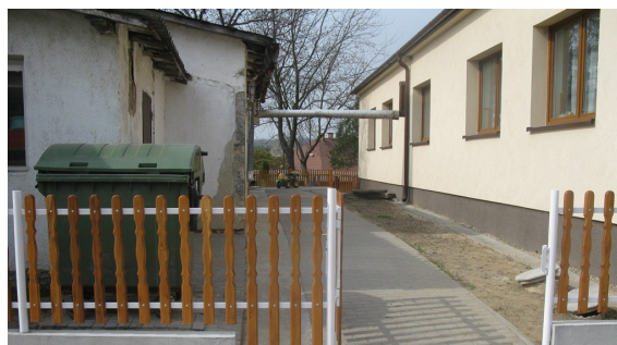
Az óvoda babakocsival is kiválóan megközelíthető

A pályázati forrásoktól függetlenül is igyekszünk szebbé és komfortosabbá tenni lakóhelyünket. Már régóta esedékes volt az óvoda babakocsi megközelítésének megoldása. Erre került sor az idei év márciusában, mikor a közmunkaprogramban dolgozók segítségével elkészült az óvoda és a Polgármesteri Hivatal közötti terület térkövezése, babakocsi tároló kialakítása, mely fölé már csak az esőtől védő tető kialakítása szükséges. Így a babakocsival közlekedők számára az óvoda már kényelmesen megközelíthetővé vált. Új kerítés készült, egységes képet alkotva az orvosi rendelőt az oviudvartól elválasztó kerítéssel, melyre szintén felkerültek a festett kerítéslécek. Újrabetonozták a munkások a Szabadság térről a Polgármesteri Hivatalba vezető lépcsőt, térköves járdát raktak az ovi és a hivatal közé, így a pince megközelítése során sem a füvet tiporják le az emberek. A parkoló felőli támfal vakolása és műgyantával történő bevonása is esztétikus látvánnyal gazdagította a központ látványát, főleg, hogy a kerítés újrafestésére is sor került. Kérjük a lakosságot, becsüljék meg ezeket a fejlesztéseket is, hisz ezek célszerű használatával, megóvásával évekig nem lenne szükség újabb javításokra!