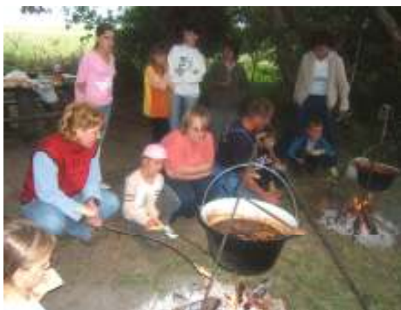
A jó illatok betöltötték a völgyet

Május 16.-án családi délutánnal ajándékozták meg magukat a Súra Rally Club tagjai, az állandó segítők, rendezők és versenyzők. Az idő kedvezett a pik-niknek. Bográcsokban főtt a pörkölt, az illatok az egész völgyet beborították. Az éhesebb gyerekek a bogrács alatti tűzön szalonnát sütöttek, közben előkerült a labda, fára másztak. Öröm volt nézni, ahogy csatangoltak, szabadon a természetben. A zenei aláfestés hatására vacsora után többen táncra perdültek, vagy csak kellemes pihenéssel, jóízű beszélgetéssel töltötték az időt. Fiatalok, idősebbek hamar megtalálták a közös témát, s hát nem múlhatott el az est anélkül, hogy ne indultak volna be a járgányok egy-egy próbaútra. Nagy sikere volt a „gyerekjáratnak”, mikor is egy-egy lassú menetben vitték körbe a csemetéket a pályán.