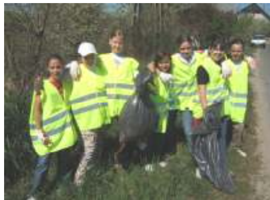
A B.csernye felé vezető főút mentén az 5. oszt. lányok álltak össze egy fotóra