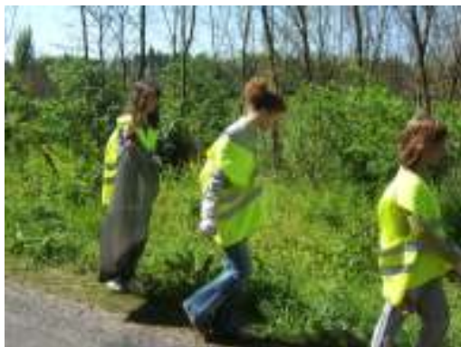
Az Ácsteszer felé vezető úton a 7.-8. osztályosok szorgoskodtak

A Föld napja alkalmából általános iskolásaink is útra keltek, hogy megtisztítsák környezetünket az eldobált szeméttől. Az alsósok a focipálya, iskola, szabadság tér környékén tevékenykedtek, míg a nagyobbak a főút környékén gyűjtötték az eldobált hulladékot. A Közútkezelő Kht. mellényekkel, kesztyűkkel látta el a gyerekeket, így már messziről látható volt a kis sárga hangyák nyüzsgése. Akadt horgukra pléhvödör, nadrág, de a legtöbb az eldobott cigarettásdoboz, és apró szemét volt. A gyerekeket kísérő pedagógusok szerint, idén sokkal tisztábbak az útszéli árokpartok, s a település központjában is kevesebb szemét gyűlt össze, mint az ideit megelőző években. Reméljük, ez a javuló tendencia tovább folytatódik, s eljön az idő, mikor a Föld napján nem lesz dolguk tanulóinknak.