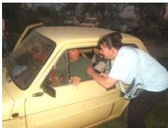
Utolsó instrukciók az indulás előtt

A következő verseny a tervek szerint Hántán a régi Kisbér-Hántai rallyversenyek színhelyén lesz megtartva június 13.-án. Az új pálya, a kevésbé ismert útvonal izgalmas versennyel kecsegtet.