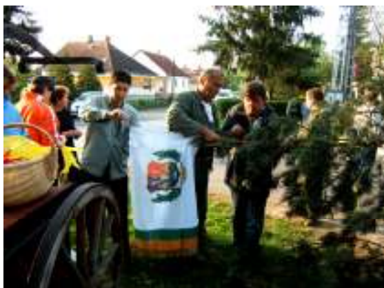
Helyére kerül, Súr címeres zászlaja

A Szabadság téren állított májusfa tetején a sári lobogó már messziről integet a településünkön átutazóknak. Hagyományoknak megfelelően május elseje előtti pénteken traktorral szállították a helyére a természetes fenyőfát, mely a tavasz eljövételét hirdeti. Miután kiválasztották a megfelelő példányt, egy nagy hó-rukk, s már a földön is volt a fa. Kicsik és nagyok együtt kötözték a színes szalagokat az ágakra, sőt jófajta bor is került a fára, melynek nagy hasznát veszik majd annak kidöntésénél. Nem kis erőfeszítésbe került a fenyő felállítás, erős férfiakok feszültek a kötélnél, majd temették be a gödröt, hogy a „májfa” masszívan állja a szelet.