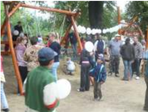
Összegyűlnek az érdeklődők