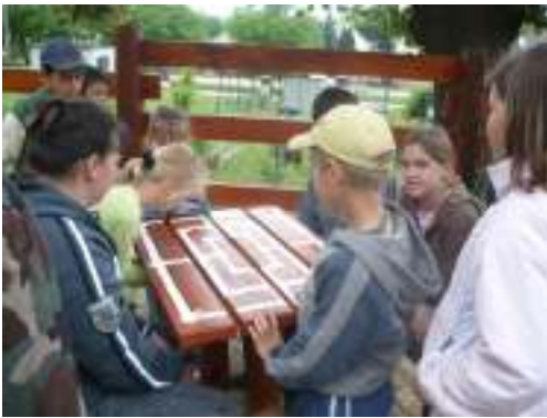
Kettő az egyben, asztal és társas