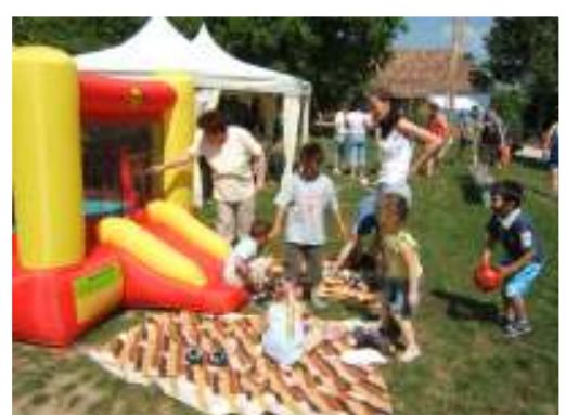
Boldogan ugránoztak a kicsik légvárban.

Az iskolások sem maradtak ki a gyermeknap rendezvényekből. Az időjárás nekik sajnos nem kedvezett, de a délelőtti kalandtúra így is nagyon izgalmas volt. Vegyes korosztályú csapatok indultak útra a környéken kijelölt állomásokhoz, hogy elvégezzék a különböző ügyességi, elméleti feladatokat. A toto, memóriajáték mellett lajhármászás, lufiborotválás is várta a csapatokat, de a babválogatás sem volt egyszerű Hamupipőke utódjainak. Üdítő, pogácsa, csoki várta a megfáradt csapatokat, s kis pihenő után újra bevetették magukat a programokba. Bicikli ügyességi versenyen bizonyíthatták tudásukat, vagy éppen buzdíthatták az Arany Kupa focimeccs csapatait. Ez utóbbi a sűrűknak nagyon ment, hisz Réde és Bakonyszombathely csapatát is megelőzve, az Arany Kupa Súr csapatát illette meg. Az osztálytermekben ez alatt a nyugodtabb programok várták a gyerekeket. Gyertyaöntéssel, agyagozással, üvegfestéssel mulatták az időt, s készültek maradandó alkotások a kezeik alatt. A SZMK köszöni a KA-BA-LA pékség, a Sógorka vendéglő, és a Müller ABC támogatását, s hogy hozzájárultak ahhoz, hogy a gyerekek napja teljes legyen.