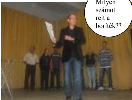
Milyen számot rejt a boríték??