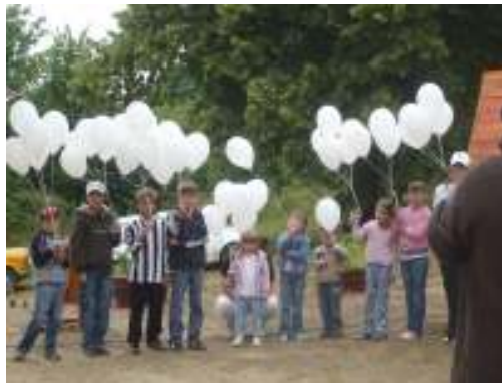
Lufik várnak repülésre