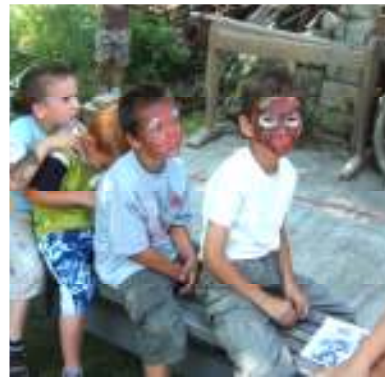
Ki is ez a pókember?