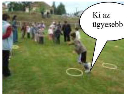
Ki az ügyesebb