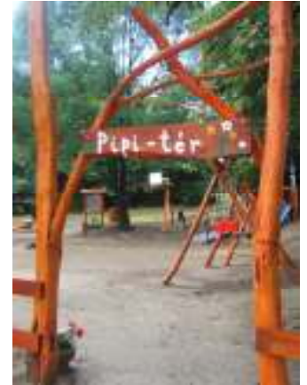
Hívogat a Pipi-tér