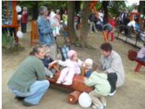
Minden játékot kibróbálunk!