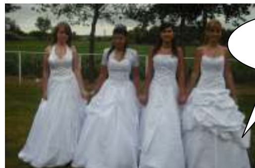
Miről álmodik a lány?