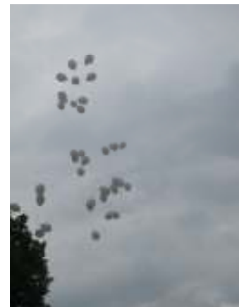
Messze száll a hírünk