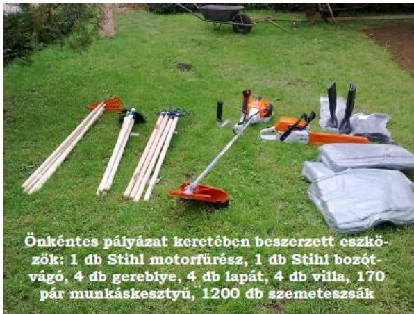
Önkéntes pályázat keretében beszerzett eszközök: 1 db Stihl motorfűrész, 1 db Stihl bozót-vágó, 4 db gereblye, 4 db lapát, 4 db villa, 170 pár munkáscsizma, 1200 db szemeteszsák

tűztük ki célul az illegális hulladéklerakók felszámolásával, közterületek takarításával. A projekt keretében a résztvevők pólókat kaphatnak, munkájukat vendéglátással tudjuk meghálálni. A megtisztított közterületekre köztéri bútorokat, kukákat, padokat tudunk kihelyezni a projekt keretében.