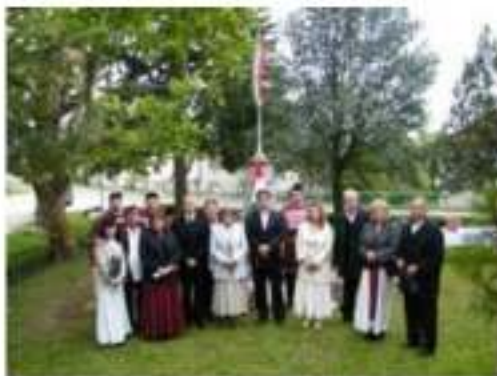
„Magyarnak lenni büszke gyönyörűség”

Hadd idézzek szemelvényeket, Pihál György múlt év június 04-én, a Magyar Nemzetben megjelent gondolataiból: