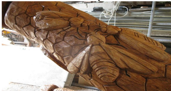
Súr címerének és a méhészet ősi foglalkozásának megjelenítése az életfán